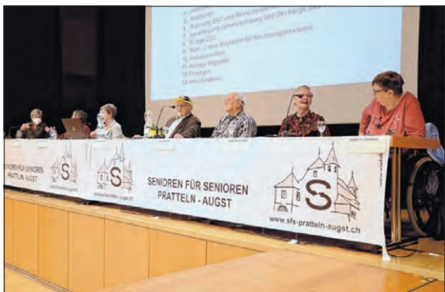
Letzten Donnerstag begrüßte der Vorstand des Vereins Senioren für Senioren Pratteln–Augst 160 Mitglieder zur GV.