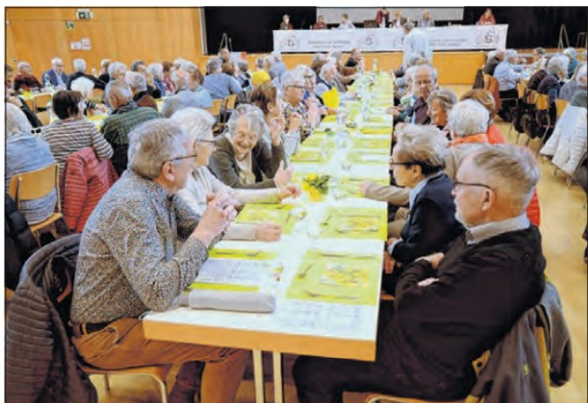
Der Saal im Kultur- und Sportzentrum war gut gefüllt und es herrschte eine gute Stimmung unter den Vereinsmitgliedern.